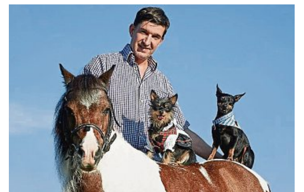
Tierschutz war ihm ein Herzensanliegen: Tom Fritsch mit vierbeinigen Freunden